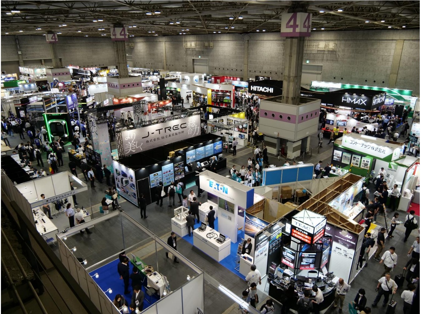
初日の会場の様子(4号館)